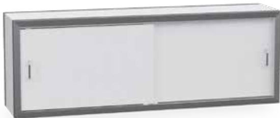
RVS wandkast met volkern deuren